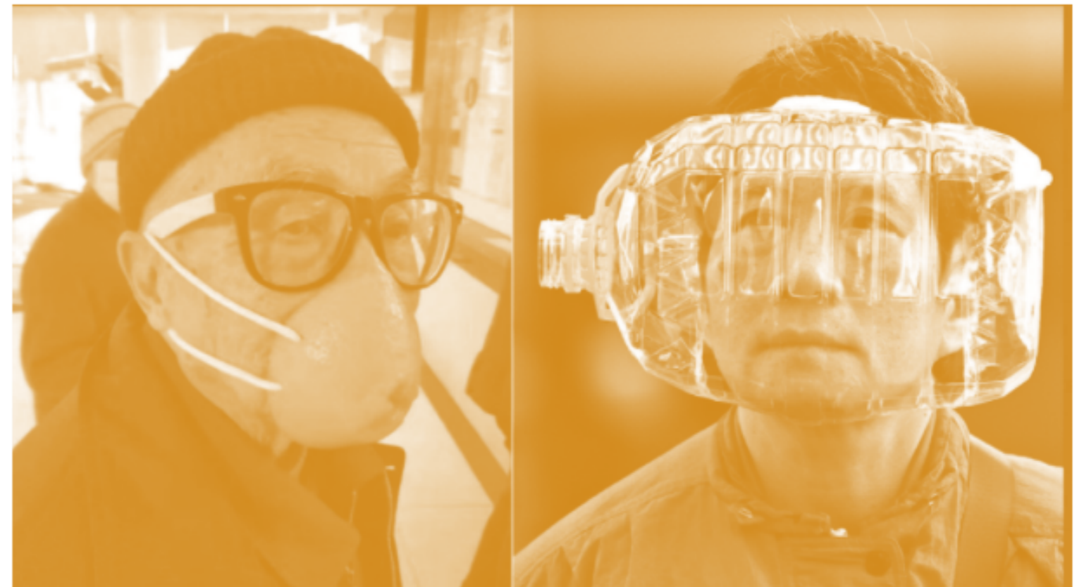
Mascarillas hechas con materiales reciclados